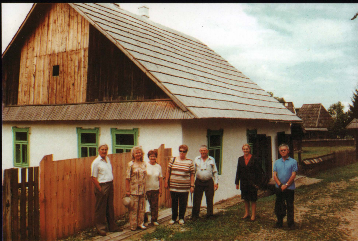
Casa evreiască a familiei Drimer din Bârsana (secolul al XIX-lea)