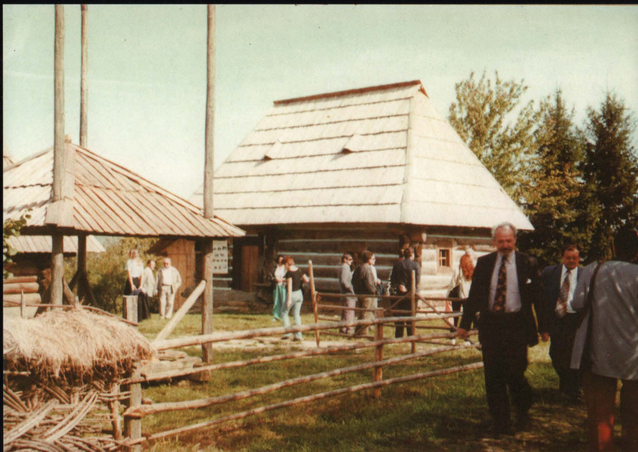
Casa ucraineană din Poienile de sub Munte (secolul al XVIII-lea)