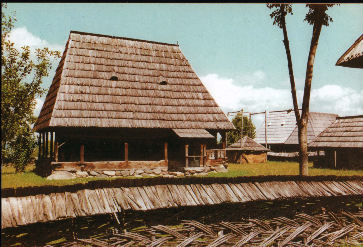
Casa Iurca "de la facerea lumii 7301" (de la Cristos anul 1792)