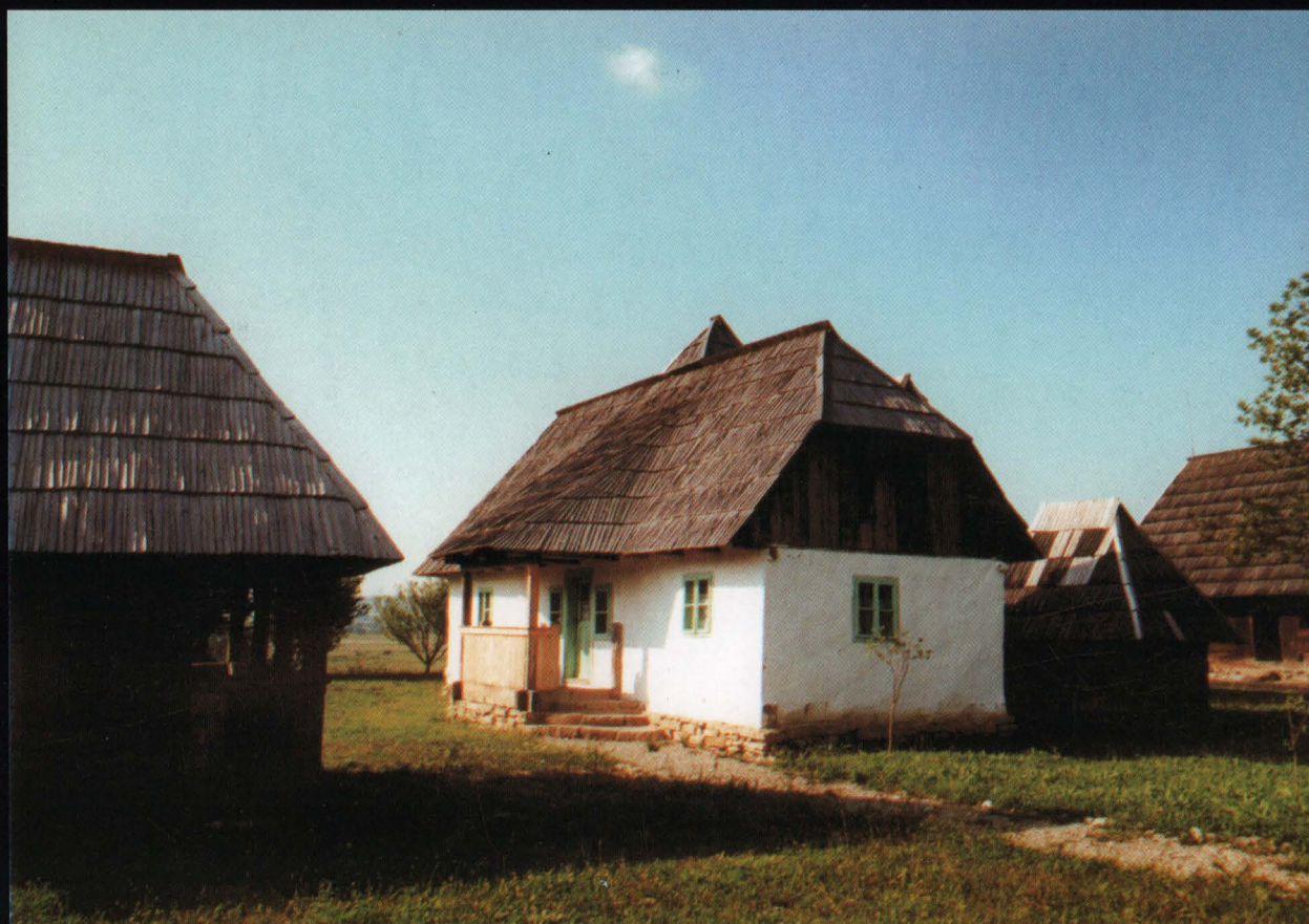
Casa maghiară din Câmpulung la Tisa (secolul al XIX-lea)