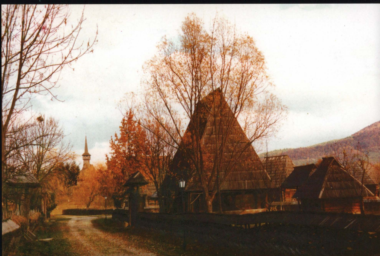
Imagine generală- În prim plan Casa Tivadar din Călinești datată 1611