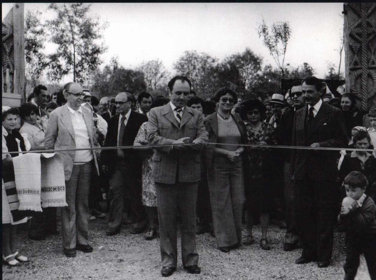
30 mai 1981 - se deschide Muzeul satului maramrueșean