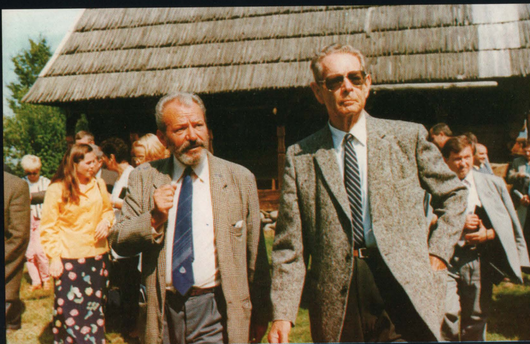
Regele Mihai I în vizită la muzeu