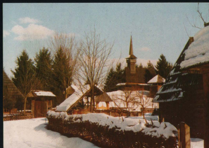
și iarna în satul muzeu