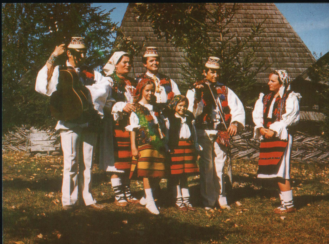
Grup folcloric în muzeu