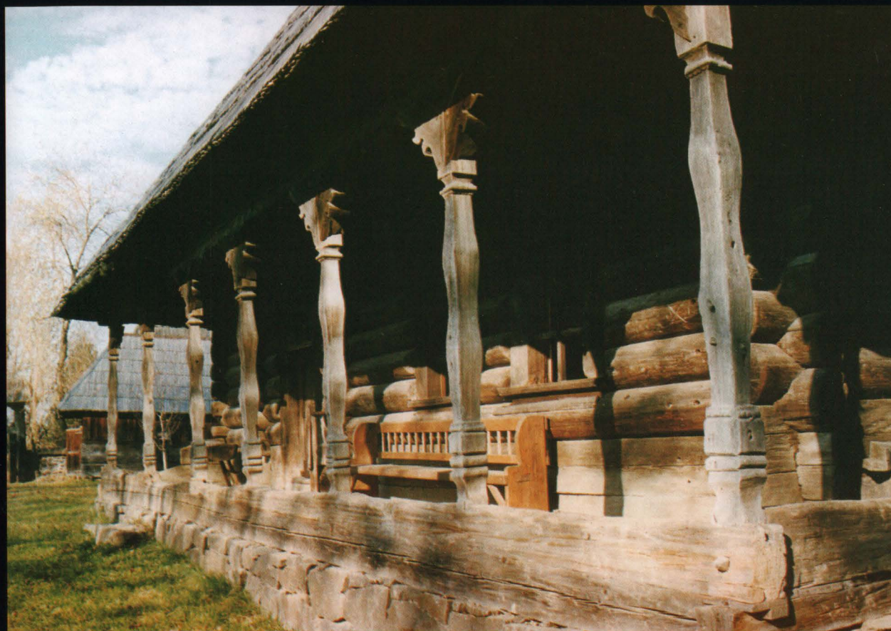
Detaliu Casa Bărcan