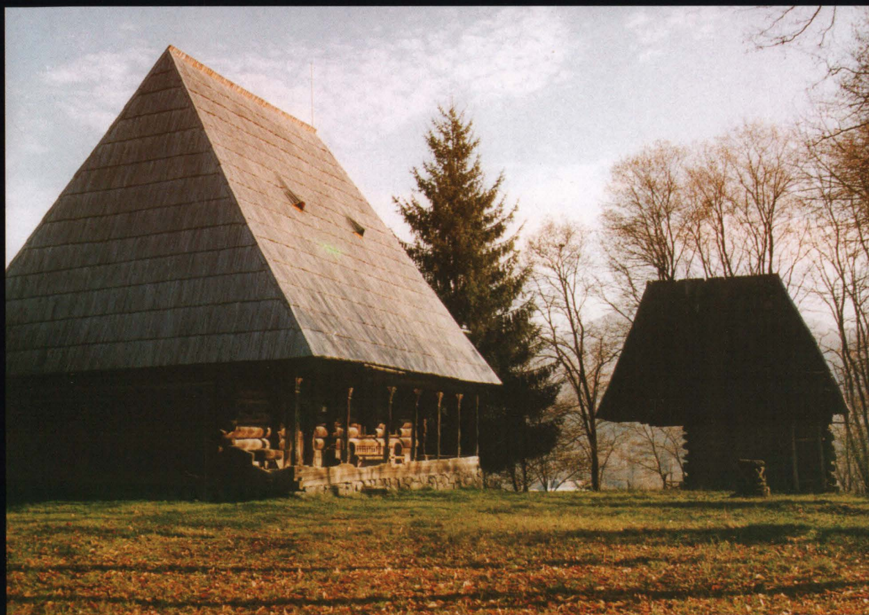
Casa Bărcan, sec. al XIX-lea