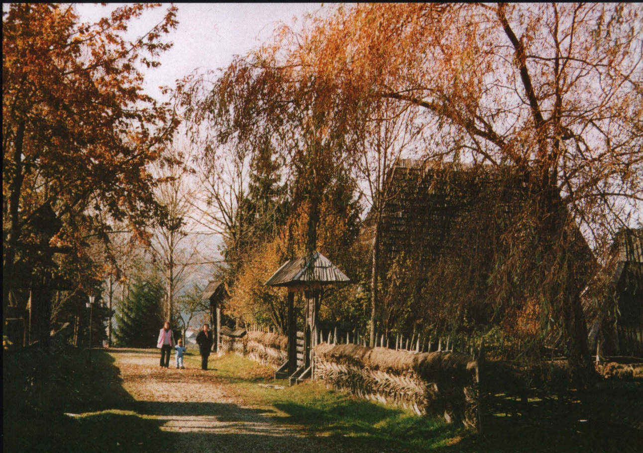
Toamna în muzeul satului