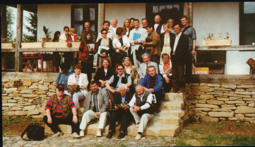
Participanți la Conferința internațională "Drumul lemnului în Europa" (1999)