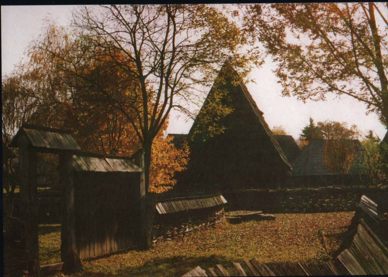
Muzeul satului maramureșean toamna